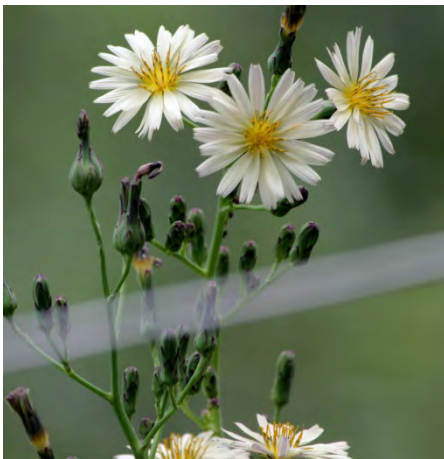
4 : アキノノゲシ