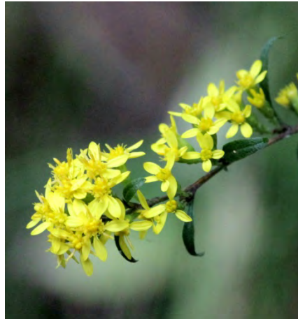
2 : アキノキリンソウ