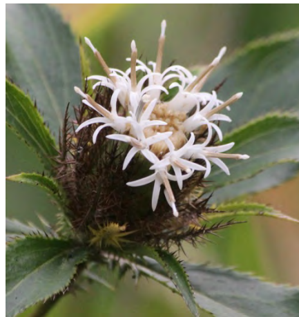
5 : オケラ