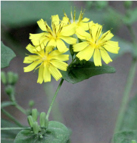
1 : ヤクシソウ

秋になり朝夕の気温が下がると共にキクの花が増えてきます。いわゆる野菊と呼ばれる菊の他に色々なキク科の花が咲きます。それぞれ個性があり楽しめます。代表的な花を紹介します。