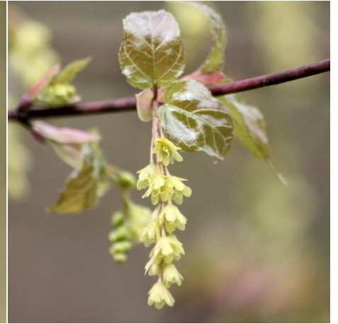
3 : ウリカエデ