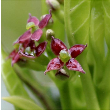
1 : アオキ

春にはヤマザクラやフジなど人目を引く綺麗な花がたくさん咲きますが、海上の森では地味で目立たない木の花もたくさんあります。地味な花もじっくり見ると意外と可愛いものです。