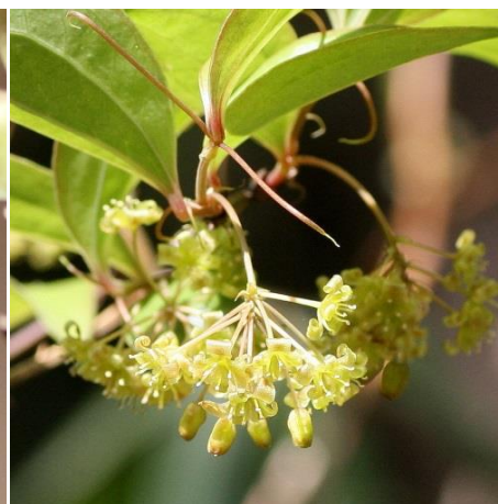
5 : サルトリイバラ