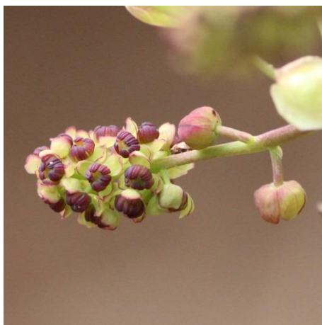
4 : ミツバアケビ