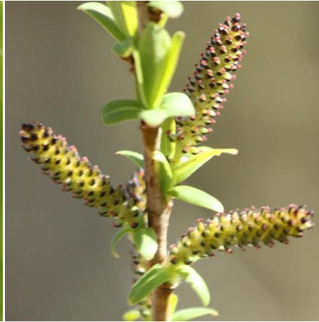
2 : イヌコリヤナギ