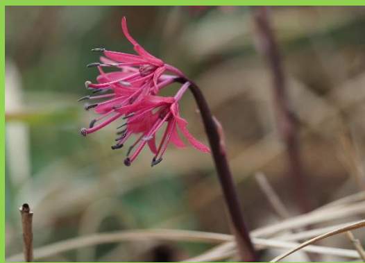
シヨウジヨウバカマ

海上の森自然ウォッチングは季節ごとにコースを変え 4月~12月まで(8月を除く)の毎月第1日曜日に開催 しています。